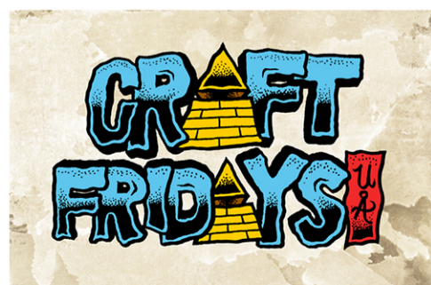
Craft Fridays UÅ