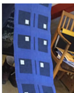
Det dräller av drällar