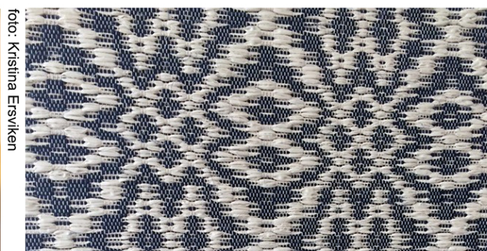
Drällväv: Wasti Nyström